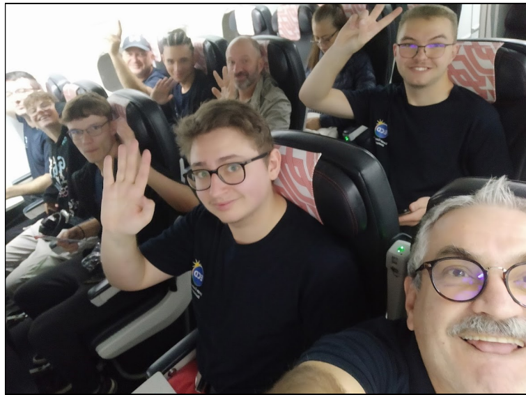
L'avion... déjà une aventure...