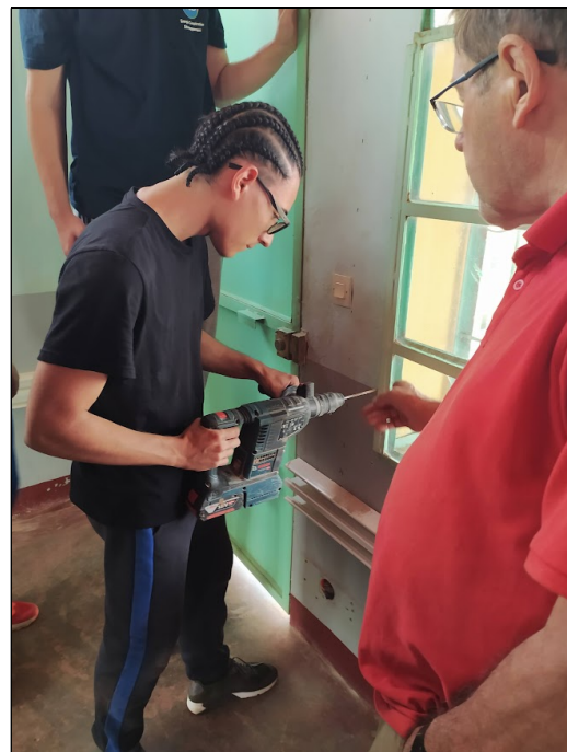
Du travail, des résultats...